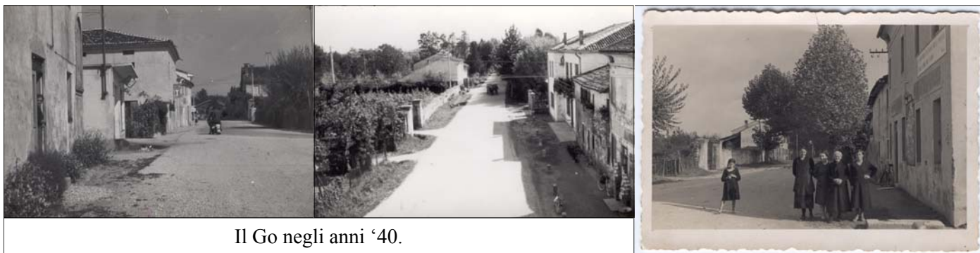
Il Go negli anni '40.

Lui le accompagnava quasi in punta di piedi, in silenzio, fino alle spalle delle donne; qui cominciava a bastonare le povere bestie che fuggivano verso il fosso, portando scompiglio tra le donne. (continua)