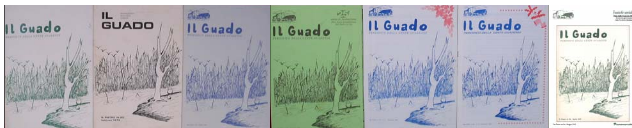
Foto: "Il Guado" e il "Fascicolo Speciale", pubblicati dalla Pro Loco Guadense