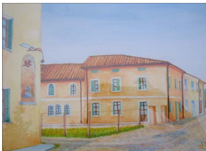
"Il Go" acquerello di Aurelio Pettenuzzo

I parcheggi del centro sono già tutti occupati dai mezzi di trasporto di questi "stranieri", che, per un giorno, hanno ritenuto importante venire a San Pietro in Gu.