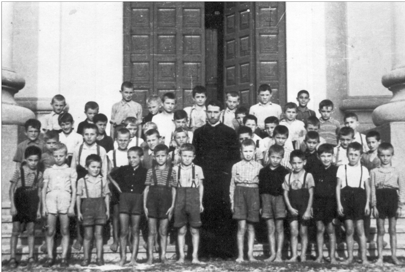
Ragazzi che si preparano per la Prima Comunione nel 1948.

Quindi il fatto di vedere quel malcapitato che si bucuva con una disinvoltura unica, senza accennare alla minima smorfia, era alquanto curioso e insolito. Dopo anni ho capito che si iniettava morfina.