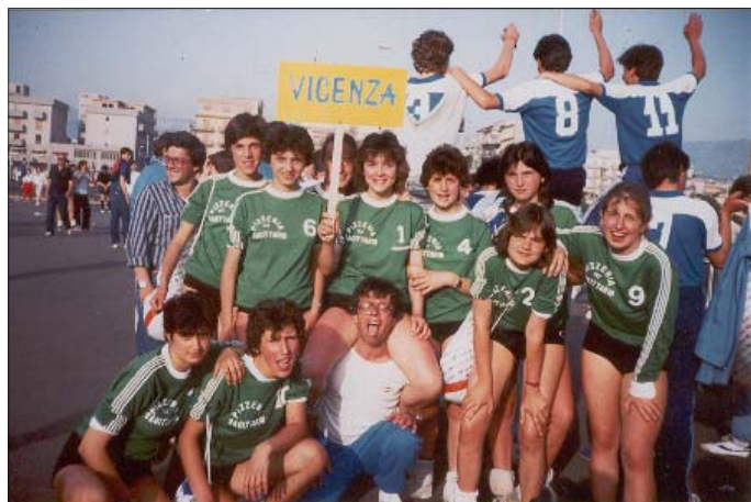
Rappresentativa della Fides Pallavolo classificatasi 3° alla festa nazionale C.S.I. di Reggio Calabria nel 1985.