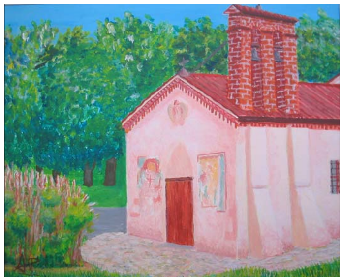
“Armedola, la chiesetta di S. Michele”

Capisco che tentare di mettere d’accordo interpretazioni così diverse porterebbe via troppo tempo ed allora propongo di incamminarci per la strada più lunga, passando per Armedola, Lanzè, il Vaticano e Barche, camminando però velocemente, in modo da raggiungere il trio di testa e dare contemporaneamente all’Ingegnere la possibilità di vedere i salti d’acqua che a lui interessano particolarmente.