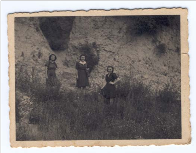
Ragazze "in gita" alla montagna.

Bepi: "Mi a go sempre sentio dire dai veci del posto che 'a montagnoea la jera sta' fata ne l'ano de 'a fame, portando 'a tera co 'e carioe, tanto aeora i poareti te 'i pagavi co' 'na feta de poenta" .