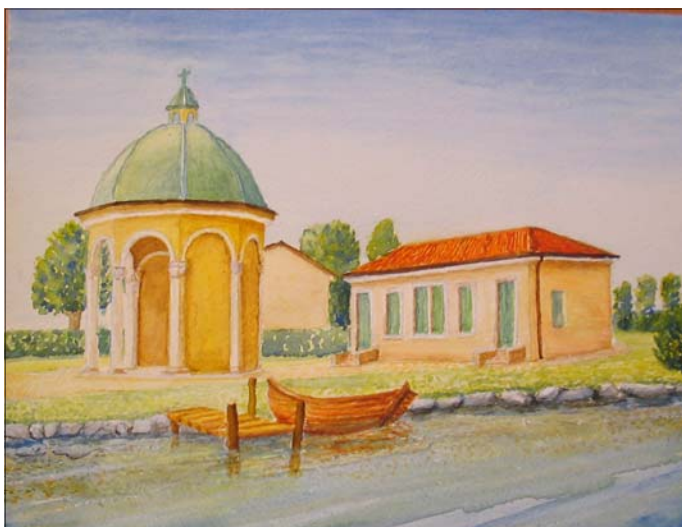
"Barche, passato e presente" acquerello di Aurelio Pettenuzzo

Superiamo gli edifici delle vecchie Scuole Elementari, il Capitello e la casa che una volta era la osteria della "Nineta".